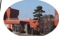
流山市生涯学習センター